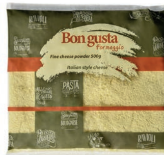
Fein geriebener Käse

Erhältlich in verschiedenen Verpackungen: Bon Gusta, Vepo Cheese Tulpen, Vepo Cheese Kuh, neutral oder blau. Möglichkeiten für Private Label Verpackungen auf Anfrage.